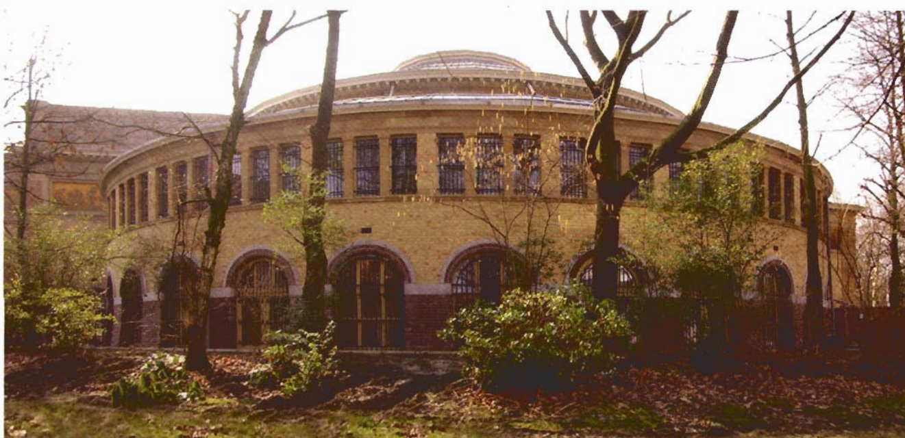
Zijvleugel van het Museum voor Schone Kunsten

De vzw Gandante organiseert deze wandeling ook op andere tijdstippen. Reservatie kan op: 0479/51 52 42 of info@gandante.be