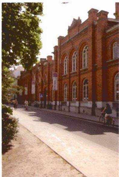
De Nijverheidsschool aan de Lindelei