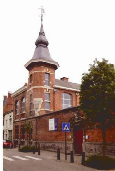
De Stadsschool in de Eendrachtstraat