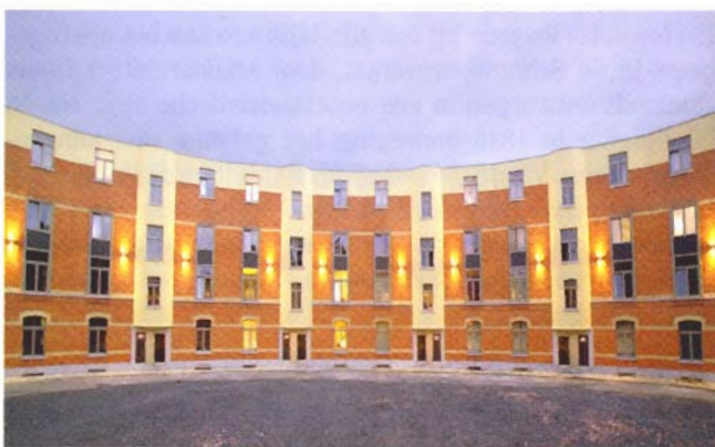
De Cirk in de Zebrastraat