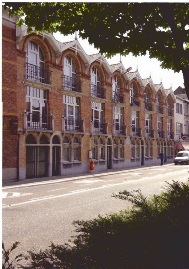
Sociale woningen aan de Rooigemlaan, de Zonnebloemstraat en het Biezenstuk

Van Rysselberghe was ook betrokken bij de verbouwing van het conservatorium. Op het einde van de 19de eeuw werd de instelling ondergebracht in de Grote Sikkel en het aanpalende gebouw, De Zwarte Moor. Van Rysselberghe werkte vooral met schermgevels, en onder meer door de inplanting van een concertzaal die plaats bood aan 600 toeschouwers is veel van het oorspronkelijke geheel verdwenen.