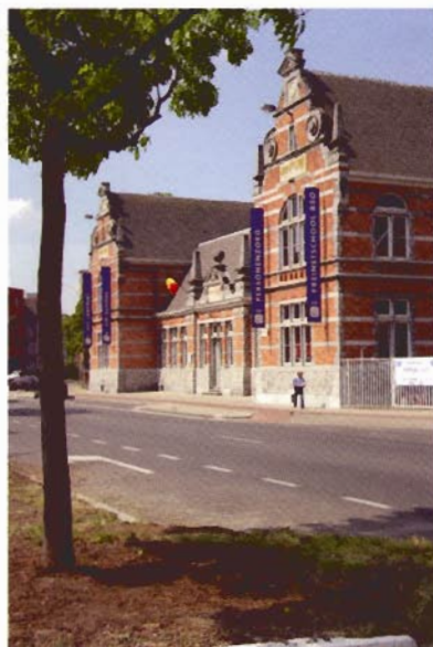
De Andriesschool in de Antonius Triestlaan