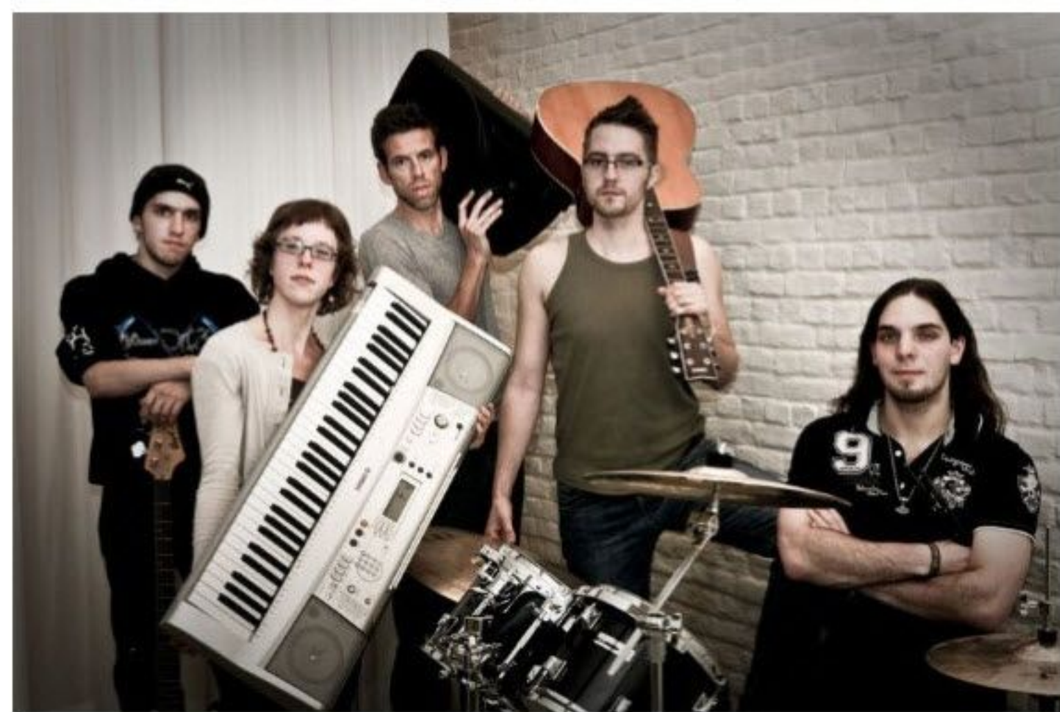
Stotterende vrienden zingen als de besten

GENT - Vijf vrienden die een muziekgroep oprichten en een song schrijven: doodnormaal, ware het niet dat alle groepsleden stotteren. Met hun single 'Talking To You' zingen ze over hun moeilijkheden bij het spreken. En nee, tijdens het zingen stotteren ze niet.