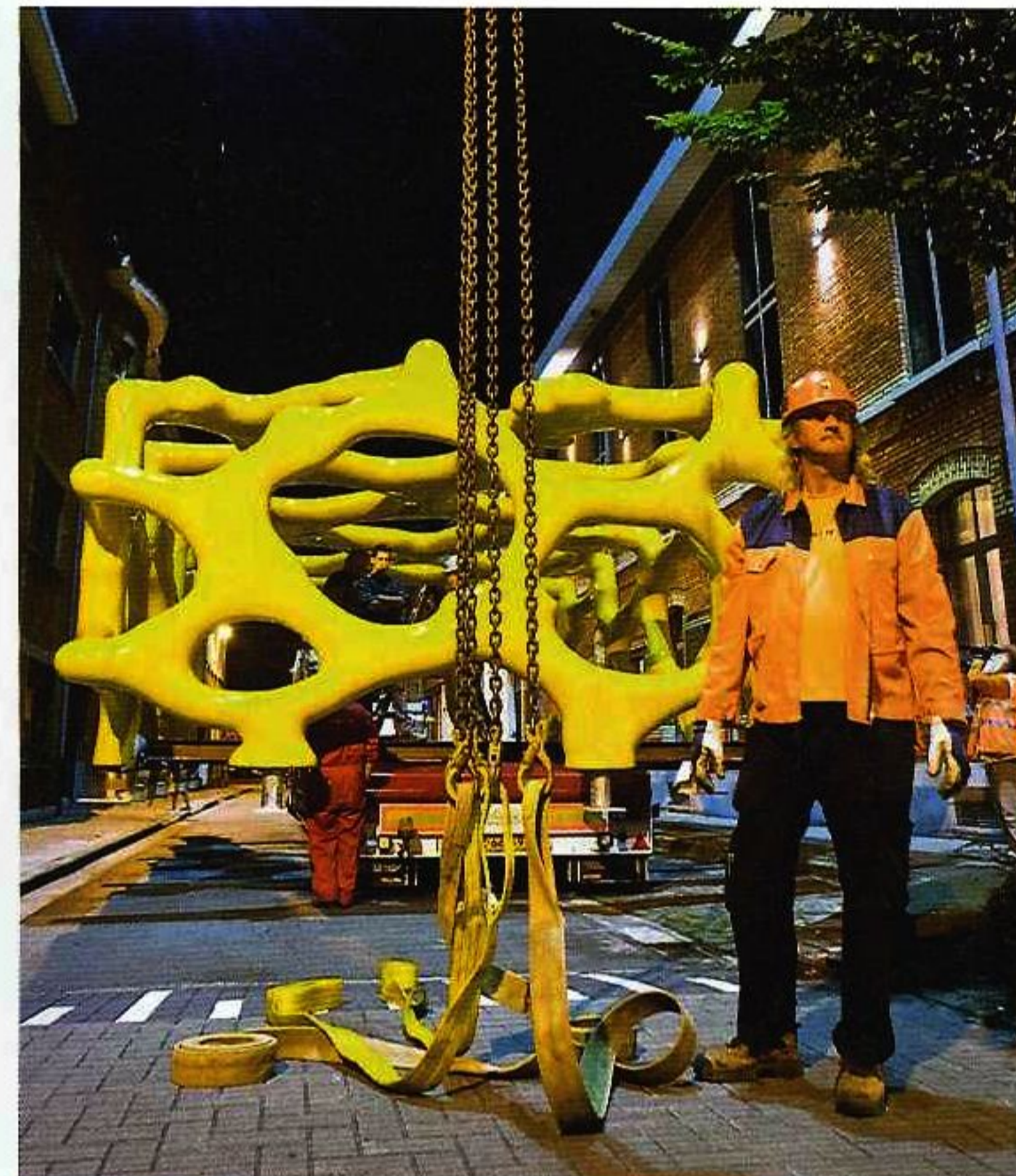
Veel speling biedt de Zebrastraat niet.

SK498-AT4 gehuurd van Michielsens. „We kunnen het hijsen ook zelf uitvoeren, maar bij een afstand van 220 kilometer zijn de kosten van aan- en afvoer te hoog om er nog wat aan over te houden. Dan schakelen we liever een collega-kraanverhuurbedrijf in. Als Michielsens bij ons in de buurt een kraan nodig heeft,