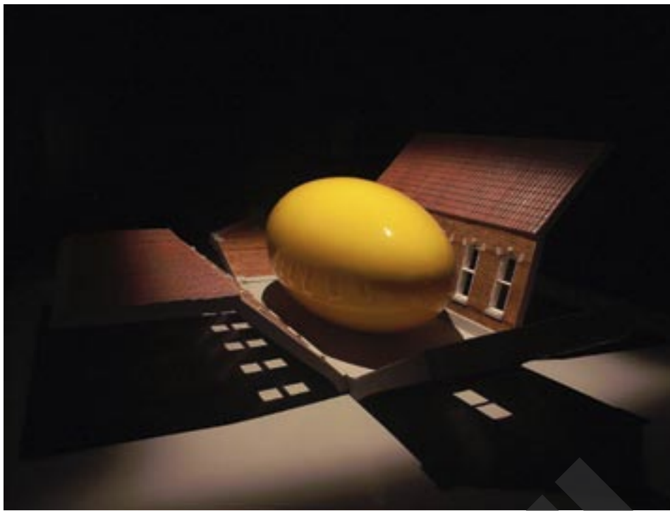
SIUTOBS 2006 BRICKS, CONCRETE, WOOD, IRON, POLYURETHANE AND POLYESTER 55 CM X 192 CM X 135 CM © NICK ERVINCK