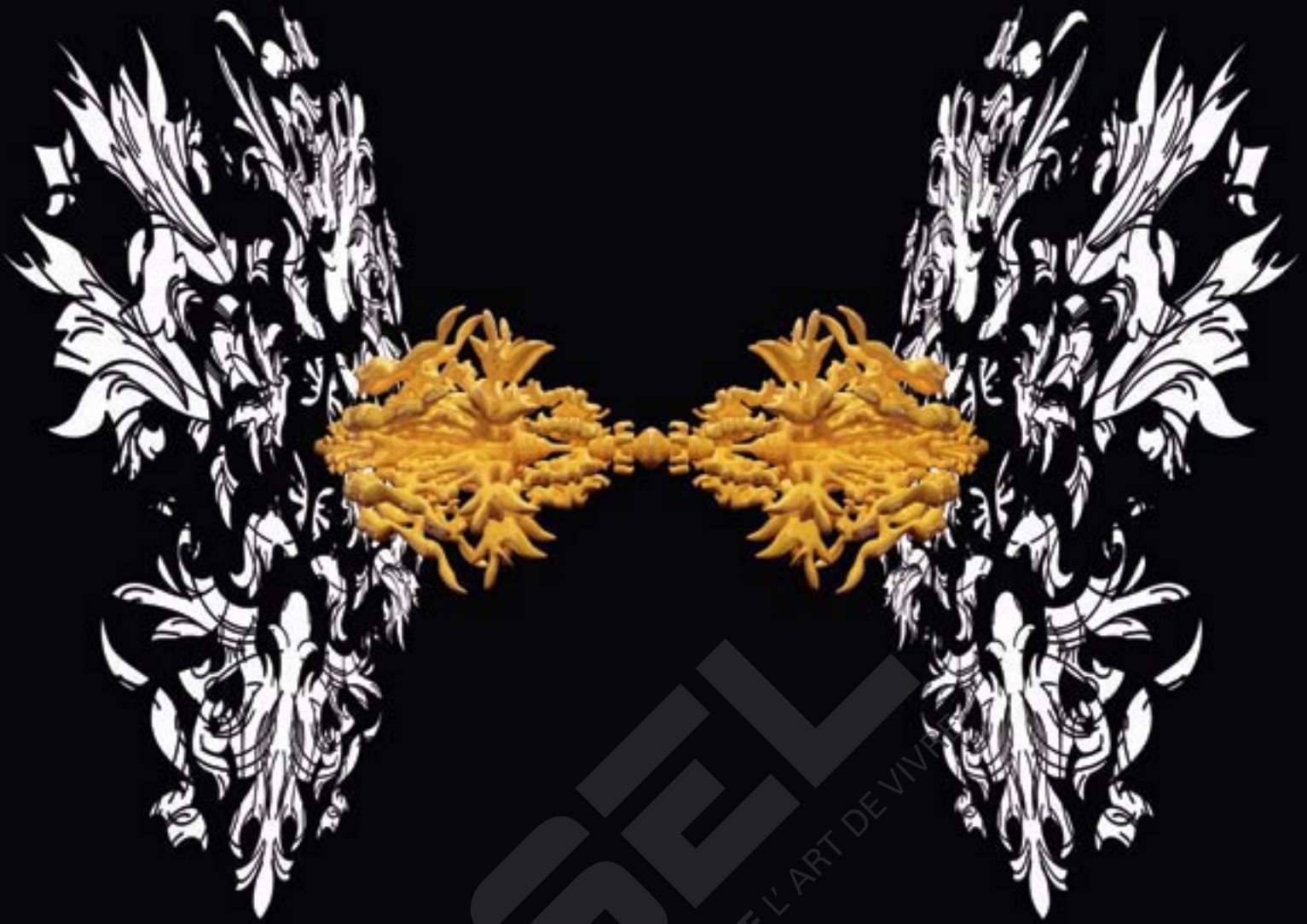
PROPOSAL DRAFT KUNST-NU SMAK GENT, B, 2009 EITZOR, 2009 POLYESTER, WOOD, IRON AND PAINT 550 X 1970 X 315 CM (VARIABLE DIMENSIONS) © NICK ERVINCK

om me louter bij dat genre te houden. Via grafische vormgeving heb ik voor het eerst ontdekt dat je met een computer meer kunt doen dan spelen.' Ook op de academie van Gent, waar hij 3D-Multimedia en Mixed Media studeerde, bleef Nick tussen zijn twee werelden schipperen. 'De logica is er', benadrukt hij. 'Interessant is bijvoorbeeld hoe je in de virtuele wereld wetten kunt omzeilen: je hoeft er geen rekening te houden met productiekosten, wind of zwaartekracht. Dat laat je toe om op een heel andere manier te ontwerpen. Momenteel laat ik me nog te veel leiden door wat al dan niet realiseerbaar is. In de toekomst wil ik ook dingen ontwerpen op computer die in de realiteit echt niet kunnen, en omgekeerd.' Op die manier laat Nick Ervinck de grenzen vervagen tussen ontwerp, sculptuur, architectuur, maquette en ruimte. Datzelfde doel bereikt hij op een verschillende manier in de sculptuur Xobbekops . Hij klikt op de foto van de maquette: 'Die is 1 x 1 x 1 meter, maar de bedoeling is om ze op 2,5 x 2,5 x 2,5 te realiseren. Zo wordt de sculptuur op zich een ruimte waarin je kunt wandelen. Voor een kunstenaar is zoiets ideaal: je neemt je eigen ruimte mee, zodat je geen last hebt van een lelijke vloer, een paal die in de weg staat of andere vervelende situaties die je in tentoonstellingsruimtes al eens tegenkomt.'