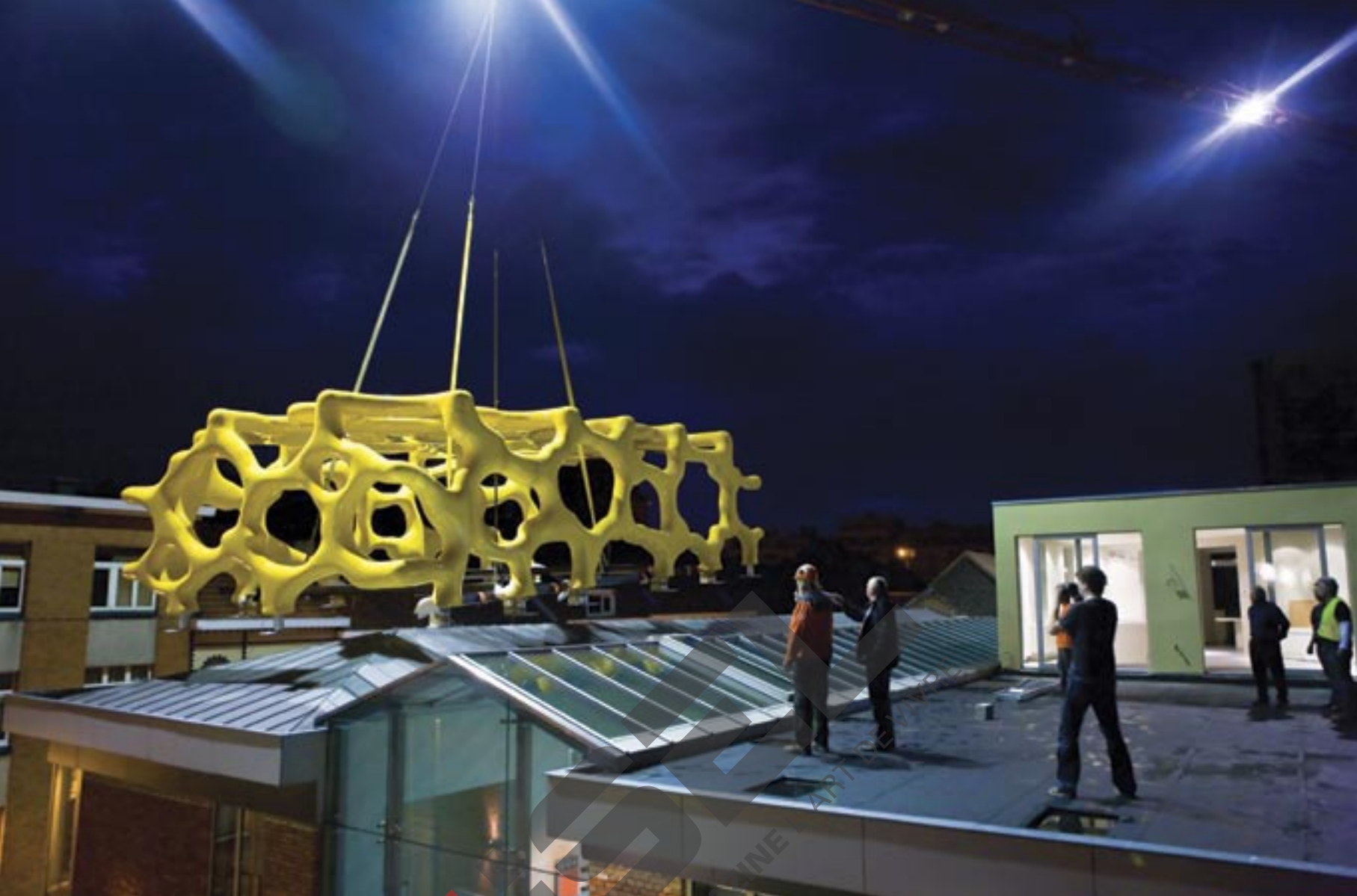
INSTALLATIE VAN 'WARSUBEC', 2009 POLYESTER, POLYURETHANE, WOOD AND IRON 2X (314 X 1222 X 647 CM)

tussen geplaatst. Het is een zware sculptuur, maar tegelijk heeft ze een soort luchtigheid in zich die suggereert dat ze elk moment van haar sokkel kan vliegen.' Het opvallendst zijn de torens van de kathedraal. Die zijn compleet uit proportie getrokken en roepen onmiddellijk het beeld van de Twin Towers op. 'Het is een knipoog naar 11 september', bevestigt Nick Ervinck. En opnieuw een bewijs dat de maatschappij mondjesmaat zijn werk binnensijpelt. Hij diept een fotoalbum op en laat me dat doorbladeren. 'Op 11 september 2001 zat ik in de metro, enkele honderden meters van de WTC-torens af. Ik wilde effectief de torens gaan bezoeken, maar vernam onderweg dat er een vliegtuig tegen was gevlogen. Ik dacht aanvankelijk aan een ongeluk met een sportvliegtuigje, dus ik wilde wel eens de ramptoerist uithangen en een kijkje gaan nemen. Eenmaal boven de grond, kwam ik in een walm van rook terecht. Ik stond nog zo'n 500 meter van de torens af, en zag van op die afstand stippen uit de ramen vallen, waarvan ik onmiddellijk wist dat het mensen waren. Ik was toen nog student en heel erg bezig met fotografie en video, dus ik had mijn materiaal bij me en heb alles vastgelegd. Ik denk dat de lens een zekere afstand heeft gecreëerd tussen mezelf en de gebeurtenissen, waardoor ik er geen trauma