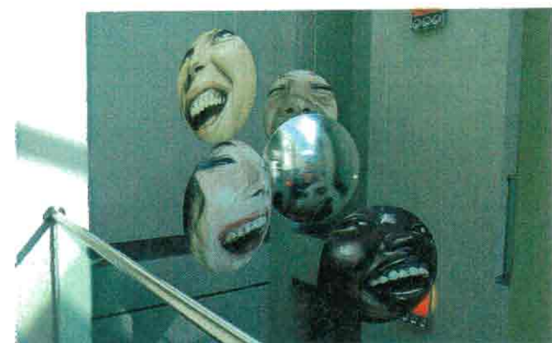
THORAZINE SUNSHINE - THOMAS HUYGHE © ZEBRASTRAAT

(1) De doelstellingen zoals genoteerd in artikel 2 van het statuut van de stichting Liedts-Meesen: "Het concept en de uitvoering van projecten en evenementen in de maatschappelijke, sociale, culturele en communicatieve sfeer, zulks in de filosofie van de rechten van de mens en de mondialisering en al hetgeen daarmee verband houdt of eraan bevorderlijk kan zijn."