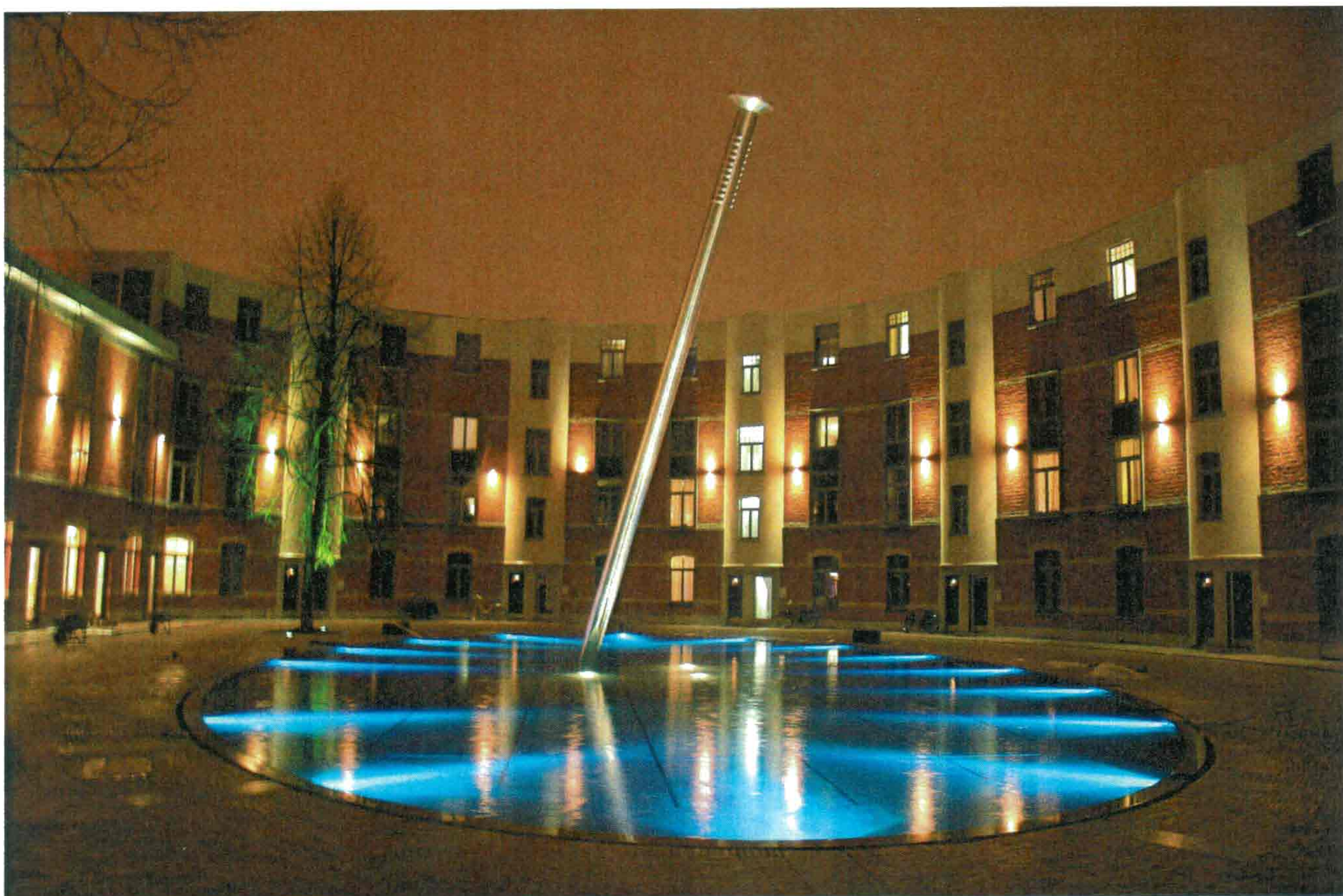
LANDSCAPE CLEAN (BINNENPLEIN ZEBRASTRAAT)

het eind van de jaren '90 echter doofde het leven er langzaam uit en werd de buurt overgeleverd aan leegstand en verkrotting. Uiteindelijk werd de site in 2002 verkocht aan de stichting Liedts-Meesen.