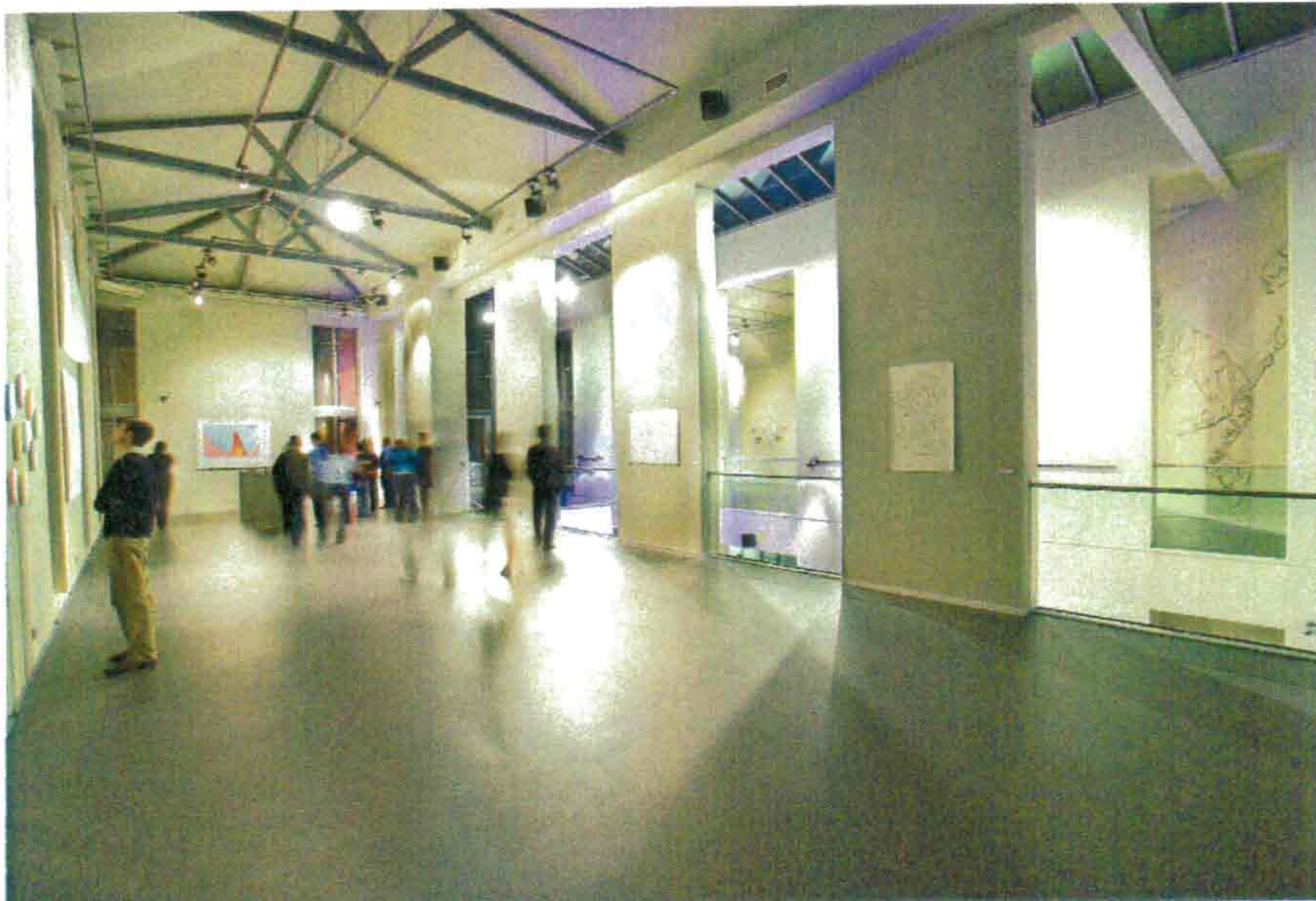
DO NOT USE POLISH (TENTOONSTELLINGSRUIMTE)

vleugel, aan de overkant van het complex, is volledig ingericht als tentoonstellingsruimte. Deze opmerkelijke combinatie heeft tot doel huisvesting, economie en cultuur te laten samenvloeien. Het project Zebrstraat steunt dan ook volkomen op de combinatie van deze drie pijlers: wonen, ontmoeten en beleven.