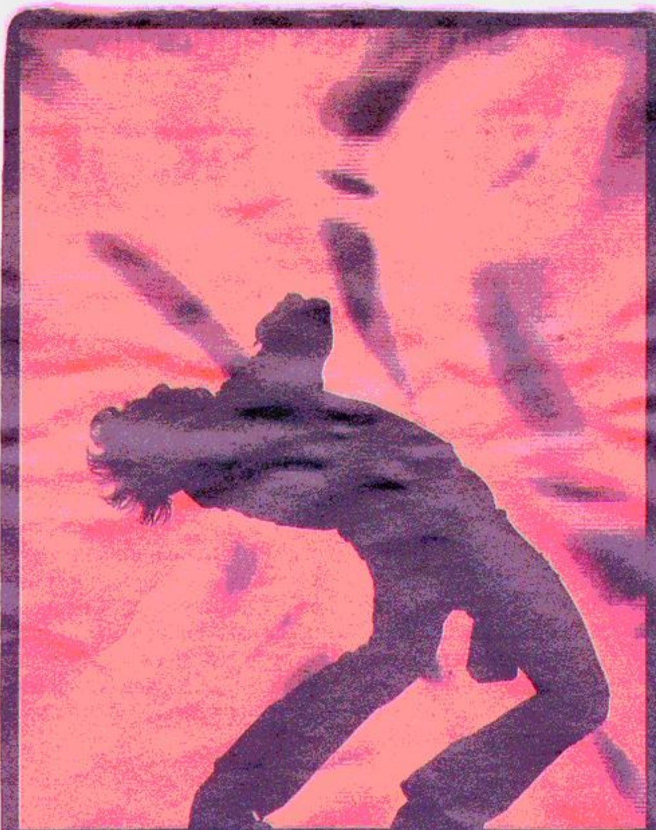
Tool - Pukkelpop, 2007

'Foto's die je niet vaak in kranten zal terugvinden'