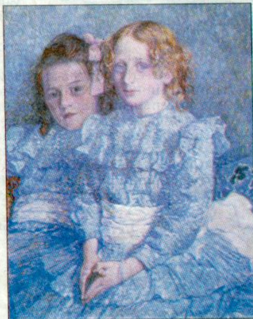
Theo Van Rysselberghe - Sœurs Guinotte

De Cirk in de Gentse Zebrastraat is niet zomaar een tentoonstellingsruimte. Het is vooral een wooncomplex. In september trokken de eerste bewoners in de volledig gerenoveerde arbeidershuisjes, die stadsarchitect Charles Van Rysselberghe in 1906 liet optrekken rond een ovaal binnen-