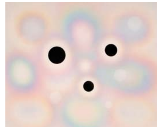
Roland Schimmel, zt, acryl op doek, 140x170cm, 2001