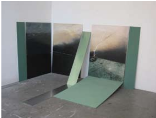
Karen Trusselle, olieverf op hout, aluminium en glas, foto op hout, 114x193x135cm, 2006